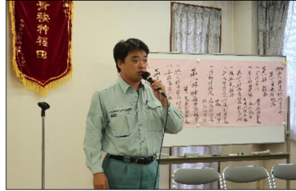
【挨拶する新任理事】